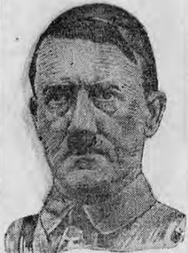
HITLER cuyo traslado al frente de batalla puede ser el anuncio de grandes actividades.