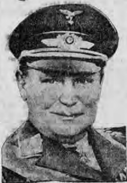
GOERING, el jefe supremo de la aviación alemana en cuya arma tiene el Reich toda su esperanza.

Alemania reanuda su ofensiva aérea contra la Gran Bretaña — Puede ser el preludio de actividades en la más vasta escala que se haya conocido hasta hoy — Hitler se traslada al frente occidental — En Goering, jefe de la aviación, tiene hoy su esperanza — No es ciego, como se dice, el Stalínismo — Sabe a donde va en su marcha sinuosa